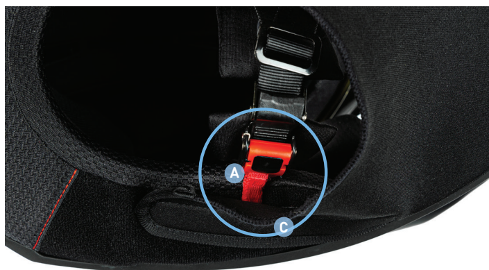
Vue de la languette coincée dans le tissu autoagrippant du protège-menton long.

La bande de tissu agrippant C du protège-menton long entre en contact avec la languette de tissu rouge A .