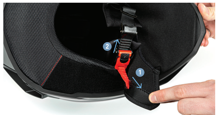
Vue de la languette coincée et accidentellement tirée avec le protège-menton long.